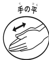
手の平 両方の手の平をこすり合わせる