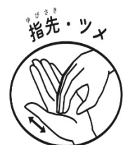
指先・ツメ もう片方の手の平にこすりつける