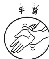
手首 もう片方の手でつかんでねじる