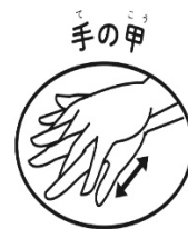
手の甲 手の甲と手の平をこすり合わせる