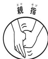
親指 もう片方の手で包んでねじる