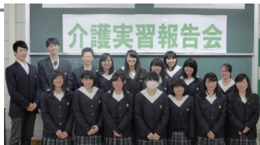
介護福祉類型1年/実習報告会

頂いて、意欲を持って取り組むことができた。介護の仕事は、大変だがとても素敵な仕事だと感じた。○介護の技術を向上させることはもちろん、利用者さんとコミュニケーションをとり、信頼関係を築くことが大切だ。職員さんの仕事の大変さに気づいた。